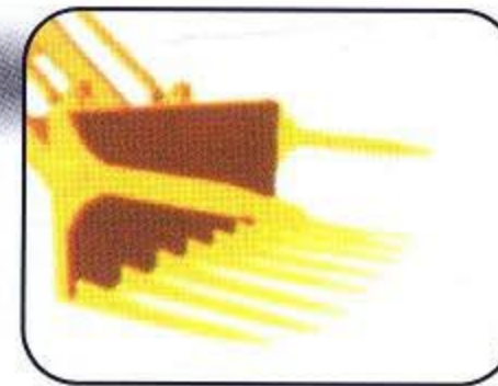
Cotton Fork Clip