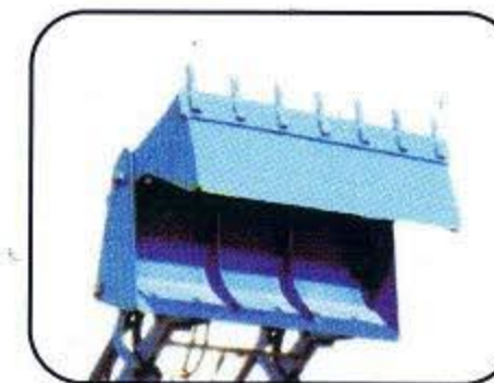
Six In One Bucket